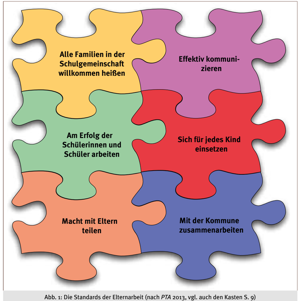
Abb. 1: Die Standards der Elternarbeit (nach PTA 2013, vgl. auch den Kasten S. 9)

Das Engagement der Eltern kann erschwert oder erleichtert werden durch Bildungsniveau und Schulabschlüsse, Kompetenzen hinsichtlich des Unterrichtsstoffes und im Hinblick auf Hilfestellungen, die sie ihren Kindern beim Lernen geben können, mehr oder weniger gute Beherrschung der Landessprache und der Landessitten, frühere und aktuelle Erfahrungen mit der Schule, erlebte Diskriminierungen, Arbeitsbelastung, zu versorgende Kleinkinder, pflegebedürftige Angehörige, Verfügbarkeit oder Nichtverfügbarkeit von Verkehrsmitteln, Belastung durch finanzielle Probleme, Beziehungsprobleme, Alleinerziehung, Drogen-, Alkohol- oder Gewaltprobleme u. v. a. m.