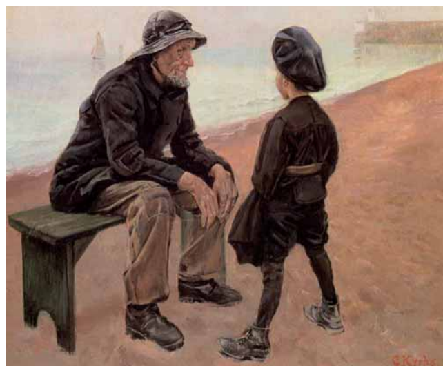
Gemälde von Christian Krohg, norwegische Nationalgalerie

Lerncoaching soll das Lernen unterstützen und begleiten, um eine bessere Passung zwischen den Lernenden und den Lerngegenständen zu erreichen (siehe Abbildung 1, Seite 280 ). Der Alltag zeigt, dass dieses Passungsverhältnis immer wieder aus dem Lot gerät. Lerncoaching ist eine episodische und periodische Klärungs- und Unterstützungshilfe für Lernende, um lebenswichtige Lernkompetenzen aufzubauen, Bildungs- und Lernsinn zu entfalten, sich mit den schulischen oder betrieblichen Wissensgebieten lernwirksam zu befassen und zunehmend das Ruder des Lernens selbst in die Hand zu nehmen. Es