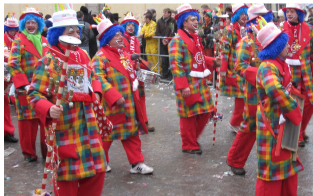
Abbildung 2: Im Veedelszoch in Köln am Karnevalssonntag

Mit welcher Wahrscheinlichkeit ist er ein Kölner bzw. ein Imi ?