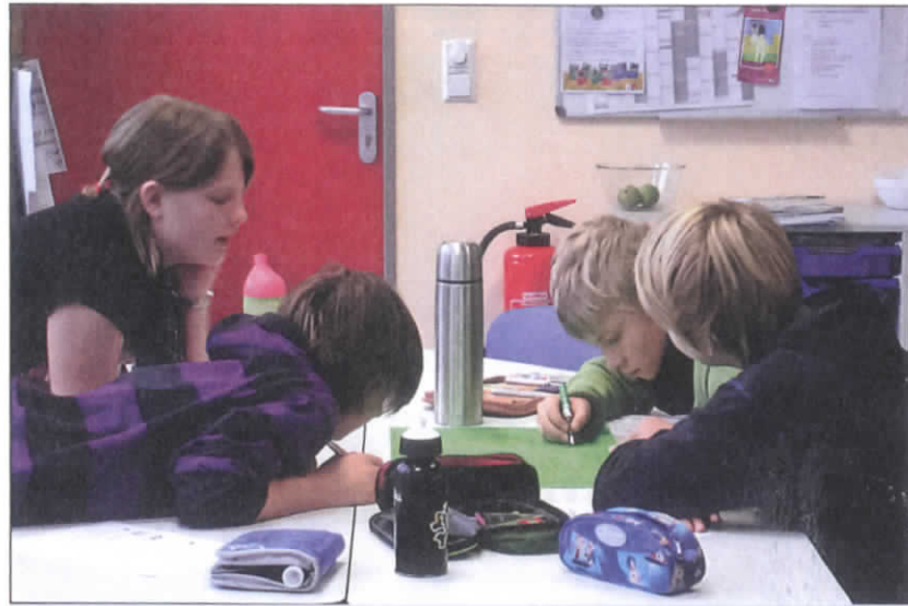
Abb. 5: Eine Tischgruppe (6. Jahrgang) erarbeitet Merkmale des Hörspiels

Eine gelingende Lerngemeinschaft braucht Strukturen der Mitbestimmung, der Übernahme von Verant-