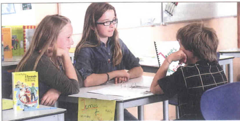
Abb. 3: Schülerin (6. Jahrgang) stellt Mitschülern ihre Experten-Arbeit zu James Krüss vor

Meinung, weil ...«, damit klar ist, dass es dir um das Bild geht.«