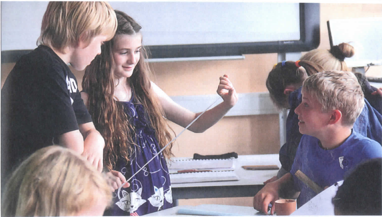
Abb. 2: Schülerin (6. Jahrgang) erklärt als Expertin Mitschülern ein mathematisches Problem