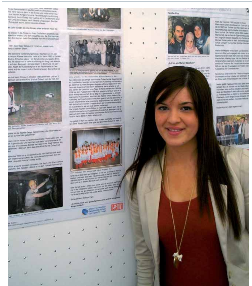
Die „Entdeckungsreise in die Vergangenheit“ wird präsentiert.

Eltern – partizipativ leben und arbeiten. Demokratielernen ist Lernen mit „Herzaugen“! Das Herz steht für einen ganzheitlichen Ansatz, für ein Handelnwollen aus der reflektierten Wahrnehmung des eigenen sozialen Umfeldes heraus oder dem eigenen Bedürfnis nach Gestaltung und Veränderung. Das „Auge“ steht für zielgerichtetes Denken und Handeln – für die Suche nach Lösungsansätzen zu selbst entwickelten Fragen oder Aufgaben. So bietet das „Lernen in Projekten“ den passenden Gestaltungsrahmen. Bei der Projektarbeit setzen sich Schülerinnen und Schüler selbstständig mit Lösungen von Problemen oder mit der Bearbeitung von selbstdefinierten Aufgaben auseinander. Folgende Merkmale treffen auf ihre Arbeit zu: