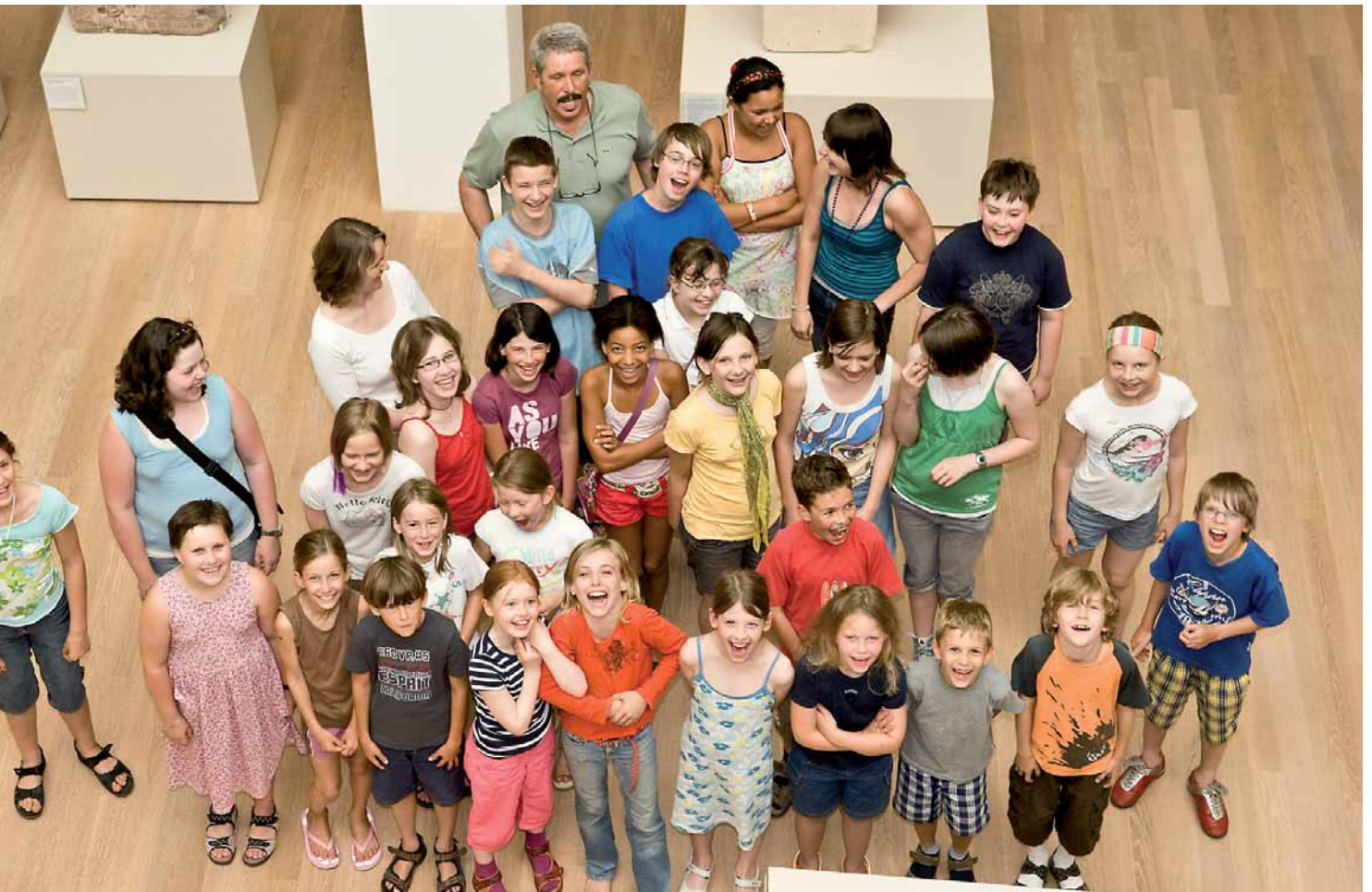
Blick in die Zukunft mit Erinnerung an die Vergangenheit

anderem mit seinem Namen verbundenen liberalen Revolution am 9. November 1848. Das geht weiter mit dem Hitler-Putsch vom 9. November 1923 und führt uns zur „Reichspogromnacht“ vom 9. November 1938. In zwei Fällen steht der 9. November jedoch auch für eine Geburtsstunde der Demokratie. So rief am 9. November 1918 Philipp Scheidemann die erste deutsche Republik aus. Und seit 1989 steht der 9. November in Deutschland mit dem Fall der Berliner Mauer auch für ein besonderes Ereignis deutsch-deutscher Erinnerungskultur: die friedliche Erlangung der deutschen Einheit in einer stabilen Demokratie nach vierzigjähriger Teilung. Mit dem Gedenken an den Fall der Berliner Mauer und das Ende kommunistischer Gewaltherrschaften in fast allen Ländern Mittel-, Ost- und Südosteuropas verweist der 9. November 1989 auf einen Auftrag für Bildung und Politik zugleich: Beide müssen für das weitere Zusammenwachsen und die Integration in Deutschland und Europas in Frieden, Demokratie und Freiheit eintreten.