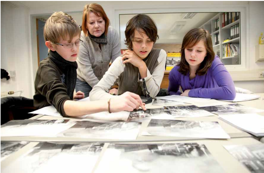
Mit Bildern der Geschichte auf der Spur

mit einer binationalen Familiengeschichte. Und doch verbindet sich in dieser je verschiedenen Erinnerung eine Aufforderung zur politischen Vernunft, zur Durchsetzung und Pflege von Vielfalt, Toleranz, Rechtssicherheit und Menschenrechten, die nur in der Demokratie erreicht und entwickelt werden kann.