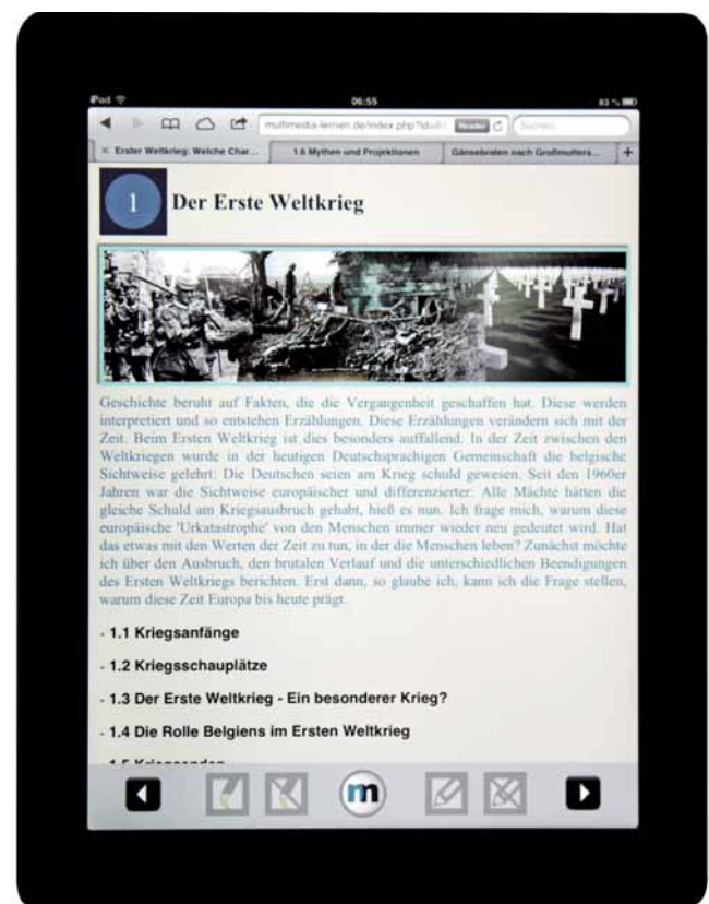
Digital-multimediales Schulbuchkapitel zum Ersten Weltkrieg