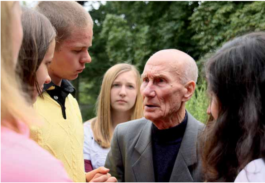
Zeit für Zeitzeugen; Foto: Körber-Stiftung/Tina Gotthardt

schulischen und unterrichtlichen Rahmenbedingungen abzustimmen. Für Projektarbeit braucht es eine gute fachliche Basis – und Zeit. Umwege, Denkpausen und Neujustierungen – alles konstitutiv für historische Projekte – sind nicht zeitneutral und unabhängig von der Präsenz des Faches Geschichte zu haben.