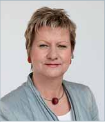
Ministerin Sylvia Löhrmann