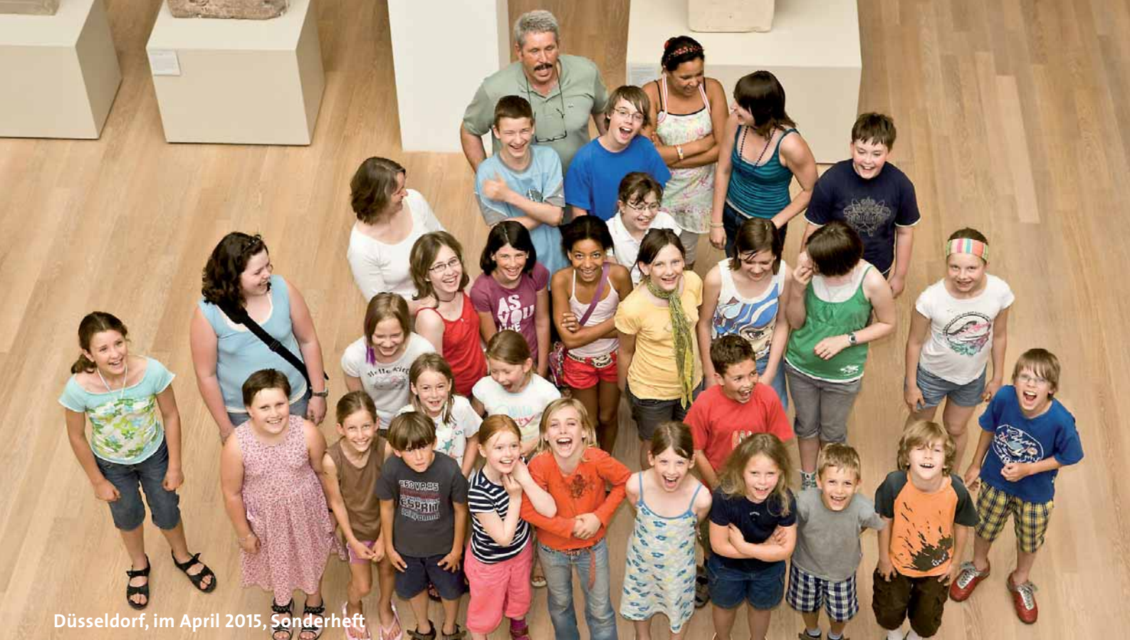
Düsseldorf, im April 2015, Sonderheft