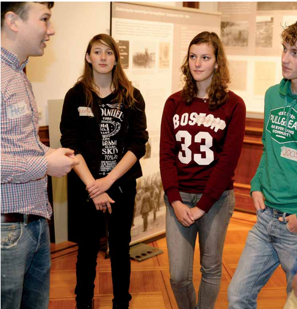
Das Gespräch über unsere schwierige Vergangenheit, das, fern von Ritualen, die Vergangenheitsdeutung mit der Gegenwartsgestaltung und Zukunftsentwürfen verbindet, ist eine wichtige Aufgabe.