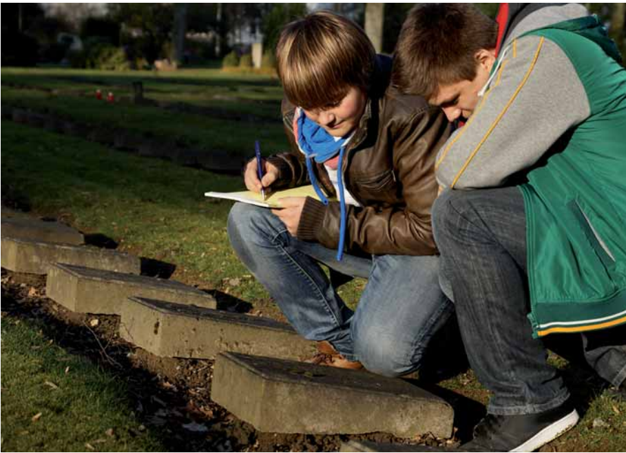
Schüler besuchen Gedenkstätten.

Um bei und nach dem Ausstellungsbesuch auch für die Auseinandersetzung mit ihrer Machart und ihren „Botschaften“ gerüstet zu sein, erhalten einerseits Lehrkräfte Unterstützung durch Handreichungen. Andererseits hilft ein Online-System den Jugendlichen durch geeignete Aufgaben und technische Unterstützung bei der Analyse. Leitfäden für den Ausstellungsbesuch sorgen dafür, dass vor Ort fotografiert, skizziert, interviewt und notiert wird, was später für die Analyse gebraucht wird. Die technisch unterstützte und unterschiedliche Ebenen umfassende De-Konstruktion regt im ersten Schritt zur Diskussion innerhalb der eigenen Klasse an. Im zweiten Schritt werden die Analysen und Darstellungen der einzelnen Projektklassen freigeschaltet und damit international zugänglich gemacht. Die Botschaften von Ausstellungen könnten beispielsweise in Richtung eines Gedenkens an die Opfer, einer Mahnung, „nie wieder“ Krieg zu führen oder einer Darstellung der als ungerrecht empfundenen Friedensschlüsse tendieren.