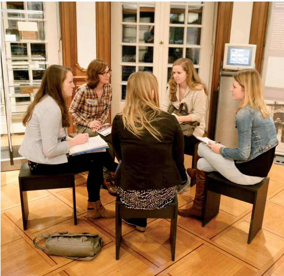
Das Gespräch über unsere schwierige Vergangenheit, das, fern von Ritualen, die Vergangenheitsdeutung mit der Gegenwartsgestaltung und Zukunftsentwürfen verbindet, ist eine wichtige Aufgabe.

Rolle bei der Geschichtsauseinandersetzung und der schüler- und jugendorientierten Geschichtsvermittlung wird auch in der Zukunft die vermittelnde Persönlichkeit einnehmen: das gilt für den Gedenkstättenpädagogen, die Archivleiterin, den Ordinarier, die unterrichtende Lehrerin oder den Schülerreferenten.