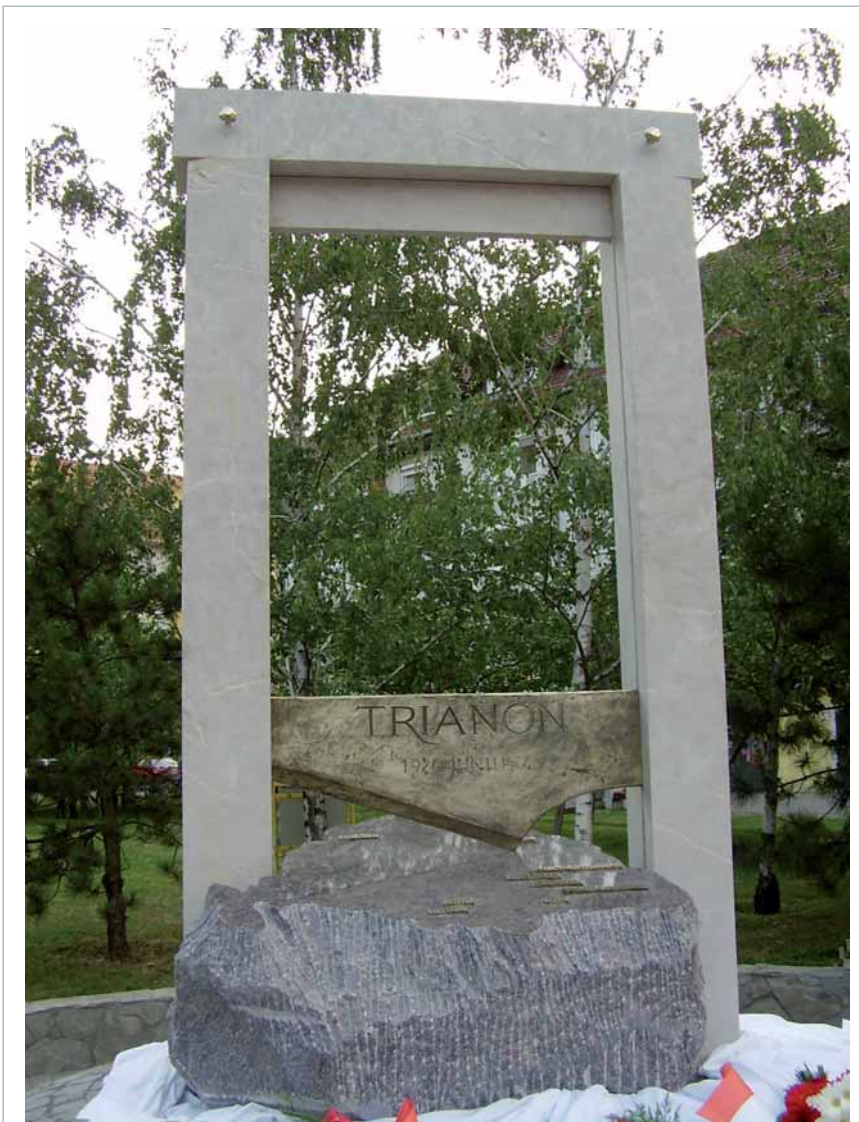
Trianon-Statue in Bekescaba

Mädchen 3: „Ich fand das auch sehr gut, dass wir auch einbezogen wurden und so selbst arbeiten mussten. Das finde ich für das