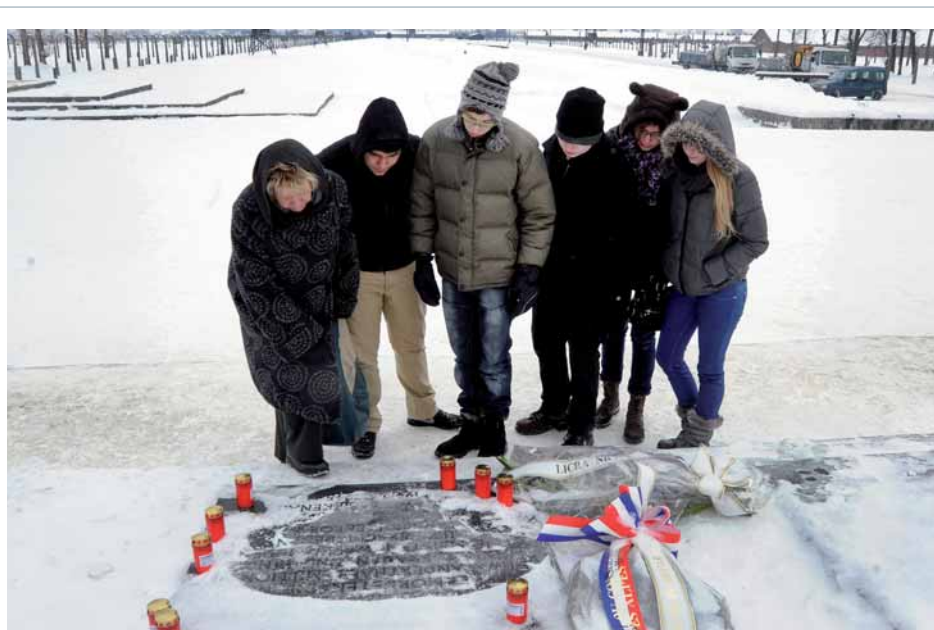
Besuch des Konzentrationslagers in Auschwitz