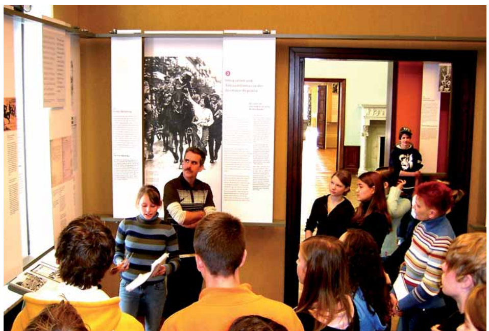
Schülerinnen und Schüler führen Gleichaltrige durch die Ausstellung im Haus der Wannsee-Konferenz.

Die im Wannsee-Protokoll festgehaltene Einschätzung, im besetzten und unbesetzten Frankreich werde „die Erfassung der Juden zur Evakuierung aller Wahrscheinlichkeit nach ohne große Schwierigkeiten vor sich gehen können“ (S. 9), stützte sich auf die weitgehende Kollaborationsbereitschaft der Vichy-Regierung. Es sollte sich jedoch herausstellen, dass die beabsichtigte Deportation aller Juden aus Frankreich, also auch der französischen Staatsbürger unter ihnen, keineswegs „ohne große Schwierigkeiten“ durchzuführen war. Insbesondere die Interventionen hoher kirchlicher Würdenträger konnten von der