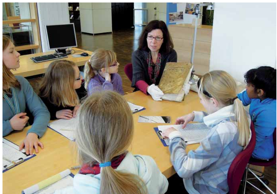
Die Geheimnisse alter Bücher ergründen; Foto: Walter Köhler

bezogenen außerschulischen Lernorte und Partner oder der Zielsetzung eines eher erkundenden, entdeckenden oder stärker forschenden Vorgehens. Selbst für den Geschichtswettbewerb des Bundespräsidenten, der mit seinen Ausschreibungen regelmäßig zur historischen Projektarbeit einlädt, ist diese Spannweite konstitutiv. Als der Wettbewerb vor über 40 Jahren initiiert wurde, schlug die Debatte noch hoch, ob es sich bei entdeckend-forschendem Lernen in Projekten generell um den „Königsweg“ des Lernens handelt oder um schlichten „Größenwahn“ seiner Propagandisten. Projektförmiges, forschendes Lernen polarisierte und geriet in der pädagogischen Debatte zur Projektionsfläche hochfliegender, zuweilen unrealistischer Erwartungen. Mittlerweile lässt sich auf der Basis von mehr als 130.000 Teilnehmerinnen und Teilnehmern und rund 28.000 Projekten beim Geschichtswettbewerb nüchtern bilanzieren: Je nach Lerngruppe, zeitlichem Rahmen und Themenstellung fallen Projekte sehr unterschiedlich aus. Wenn im Kern die Selbstständigkeit des Arbeitens unter Einhaltung methodischer Standards und die Reflexion von Lernziel und Lernweg gegeben sind, ist diese Vielfalt aber eher Stärke als Schwäche und zeigt, dass es darauf ankommt, Projekte auf die jeweils unterschiedlichen