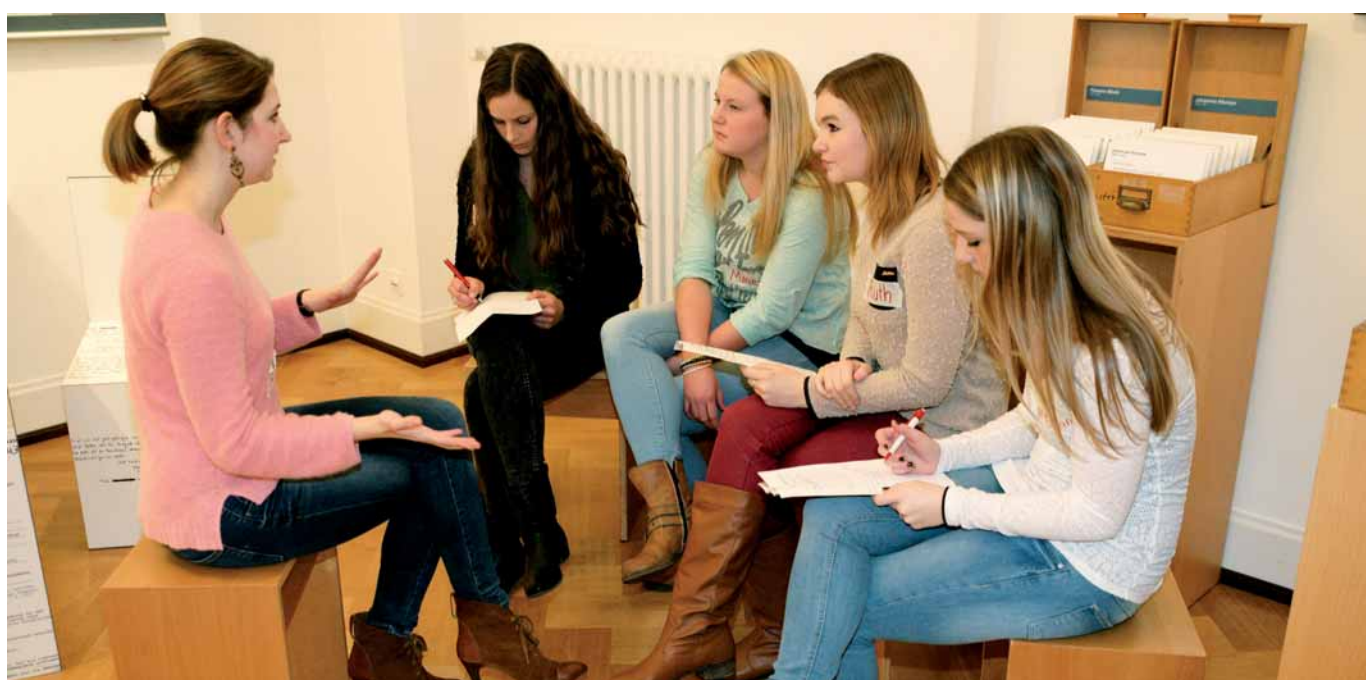
Das Handeln von NS-Tätern historisch-kritisch erklären, ohne es zu entschuldigen: Bildungsarbeit am Geschichtsort Villa ten Hompel.

an der teilnehmenden Beobachtung des Gerichtsbesuchers Krüger ist nicht nur seine Aufmerksamkeit für die Schülerinnen und Schüler, sondern auch seine düstere Prognose für die Erinnerungsarbeit über den Zweiten Weltkrieg und den Holocaust in deutschen Schulen gegen Ende des 20. Jahrhunderts. Wie wir aber heute wissen, ist die entworfene Vision historischen Lernens, in der für die Jugendlichen und jungen Erwachsenen die Zeit des Nationalsozialismus gleich weit entfernt wie die Schlacht gegen Attilas Hunnen 451 nach Christus, nicht Wirklichkeit geworden. Das hat seine Gründe sowohl in den konstanten menschlichen Handelns, zu der auch die Erinnerung zählt, als auch in der mittlerweile erreichten Sensibilität in unserer Zivilgesellschaft und damit auch in den Schulen für die Geschichte der nationalsozialistischen Gewaltherrschaft. Vor allem eine vitale Zusammenarbeit zwischen den in der Fläche Nordrhein-Westfalens breit aufgestellten NS-Gedenk- und Erinnerungsstätten und den Schulen könnte diesen Stand der reflektierten Geschichtsorientierung erhalten helfen und weiterentwickeln.