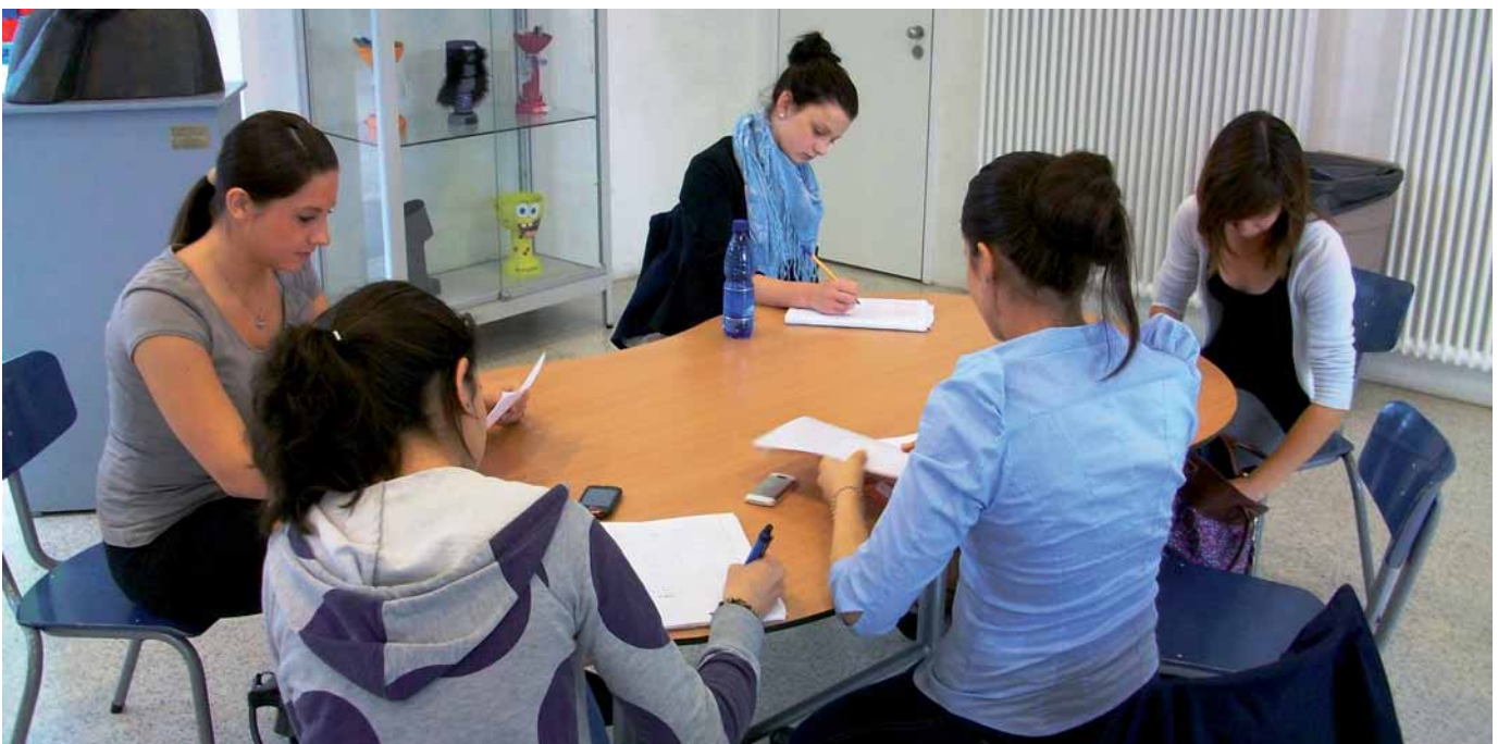
Recherche: Wie kam meine Familie nach Marl?

Da dieses forschende Lernen auch zur Rekonstruktion von sogenannten „Zuwanderungsgeschichten“ geführt hat, die auf