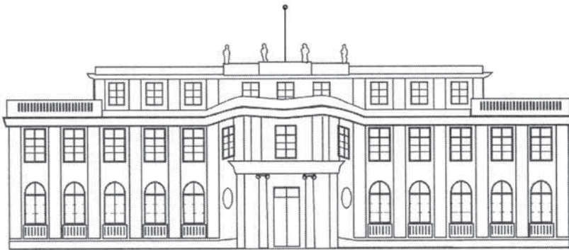
Haus der Wannsee-Konferenz - Gedenk- und Bildungsstätte

der Unterstützung durch Ludin, der Weisungen von Staatssekretär Ernst von Weizsäcker erhielt. Schließlich wurde vereinbart, dass die slowakische Regierung das Vermögen der deportierten Juden beanspruchen konnte, aber für jeden deportierten Juden 500 Reichsmark an die Reichsregierung bezahlen sollte. Trotz der weiter bestehenden Möglichkeit, Befreiungsbescheinigungen zu erteilen, wurden bis zum Oktober 1942 insgesamt 57.628 slowakische Juden in die Vernichtungslager Auschwitz und Majdanek sowie in den Distrikt Lublin deportiert. Nach der Niederschlagung des Slowakischen Nationalaufstandes Ende August 1944 und der Besetzung des Landes durch deutsche Truppen wurden noch einmal mehr als 13.000 Juden aus der Slowakei deportiert und etwa 1.000 in der Slowakei selbst ermordet. Insgesamt haben wenig mehr als 10 Prozent der slowakischen Juden überlebt.