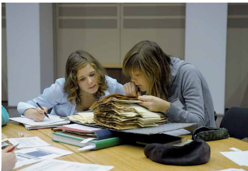
Spurensuche in Akten aus dem Archiv

Die lokale Ausrichtung von Projekten bietet auch den Tutorinnen und Tutoren einen Mehrwert: Sie erweitern ihre Kenntnisse der Ortsgeschichte und nicht selten erwächst aus der Beschäftigung etwa mit Themen wie dem Nationalsozialismus ein eigenständiges lokalhistorisches Engagement. Im Laufe der Zeit