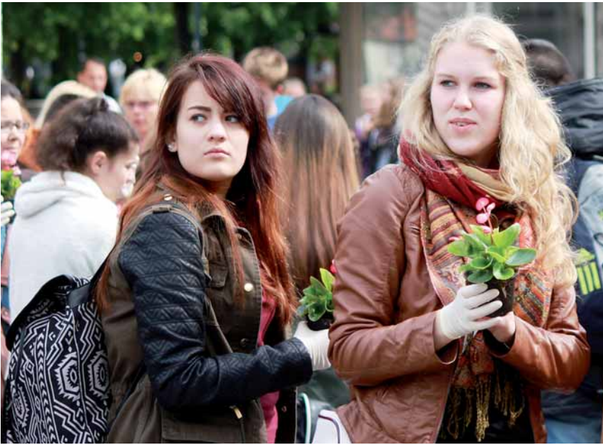
Erinnern für Gegenwart und Zukunft

dungsarbeit Schülerinnen und Schüler unterschiedlicher Schulformen sowie verschiedener ethnischer und sozialer Herkunft zusammen: Erinnern für Gegenwart und Zukunft.