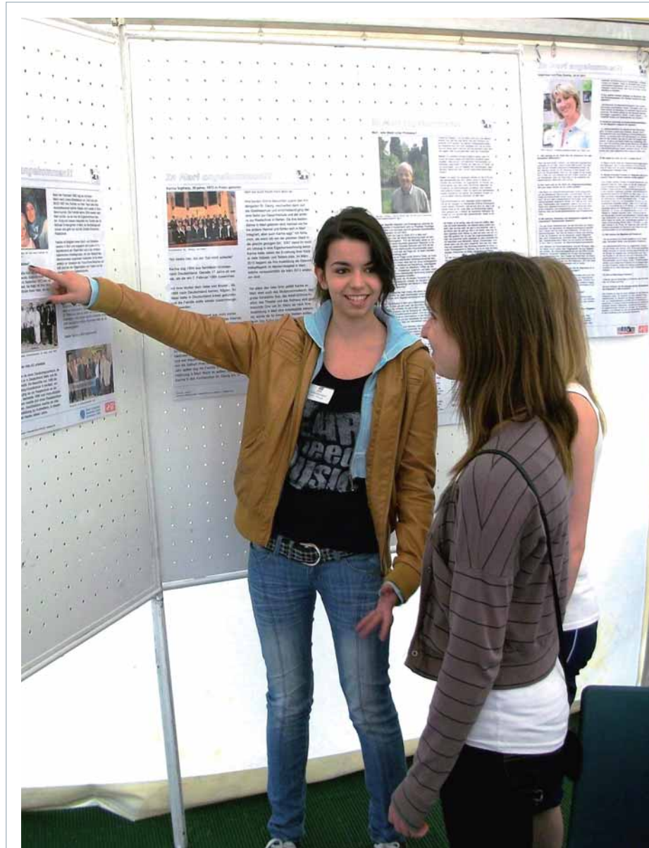
Schülerinnen bei der Projektarbeit

reitschaft, mit den Ergebnissen des Projekts an die Öffentlichkeit zu treten.