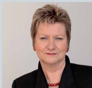
Ministerin Sylvia Löhrmann

Erinnerungskultur bewährt sich in ihren Perspektiven für Gegenwart und Zukunft. Es geht mir darum, dass Schule das schwierige Erbe von Gewalt und Diktatur, von Ausgrenzung, Misshandlung, aber auch die gemeinsame Erinnerung an Geburtsstunden der Demokratie aufgreift und würdigt, wie etwa die Befreiung vom Nationalsozialismus am 8. Mai 1945